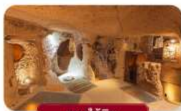
นครใต้ดิน