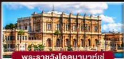
พระราชวังโดลมาบาห์เซ่