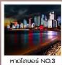
หาดไซเบอร์ NO.3

ซิมฟรี!! ...เบียร์ชิงเต่า สูตรออริจินัลดั้งเดิม ...ท่านละ 1 แก้ว