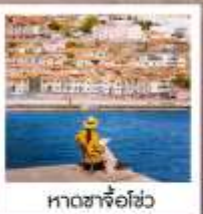
หาดซาโจ่วเซว

เรือยวี่ / ย่านฉินเฟิงฟาง / สวนเว่ยไห่ / WEI HAI WINDOW / ถนนฮวงวีป้า สวนหย่อมโกทอน / เมืองท่าฮวงไห่ / หอคอยตาควง / ชายหาดจินซา / รูปปั้นปลาฉลาม แปดเซียนข้ามถนน / หาดทรายซาโจ่วเซว / หาดไซเบอร์ NO.3 / สวนจงซาน / ถนนหลงเจียง พิพิธภัณฑ์ว่าการท่าเรือ / Silver Fish St. / สะพานจินเจียว / โบสถ์ St. Emil ถนนป้าฉาถวน / ห้างเว่ยซานไห่จียิม NIGHT MARKET / QINGDAO HAITIAN CENTER ชั้นB1 โรงงานเบียร์ชิงเต่า / ถนนเลียบชายหาดปิ่นไห่ปูจ้านเต่า / ถนนคนเดินไถ่ถง