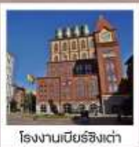
โรงงานเบียร์ชิงเต่า