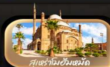
สุเหร่าอิบน์ตุลูน

Highlight มหานครแห่งอารยธรรมมีปลุกตำนานอันโด่งดัง พระมิดขินบันไดที่ซัคคารา สามยักษ์ใหญ่แห่งทะเลทราย พระมิดแห่งกิซา และผู้พิทักษ์มหาส핑크 พลาดไม่ได้! พิพิธภัณฑสถานอียิปต์ และพิพิธภัณฑสถานอียิปต์ สำรวจ ย่านคอปติกโคโร สุหร่าอิบน์ตุลูน อาลี ป้อมปราการโคโร หอคอยโคโร ถนนไนล์คอร์นิช ซุปป์ิง ถนนอัลมุฮิซ ซิสติน อัลลอรี ตลาดงานเอลคาลิซี