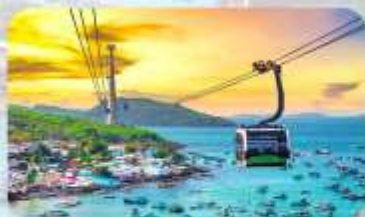
Hon Thom Island