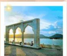
Ana Sagar Lake