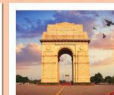
♥♥♥ India Gate