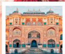
♥♥♥ Amber Fort