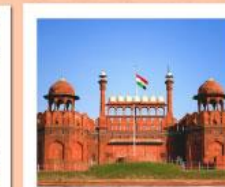
♥♥♥ Agra Fort