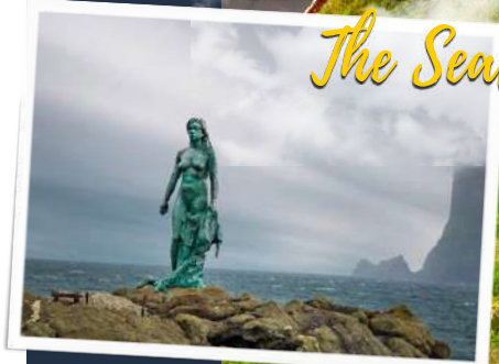
The Seal Woman